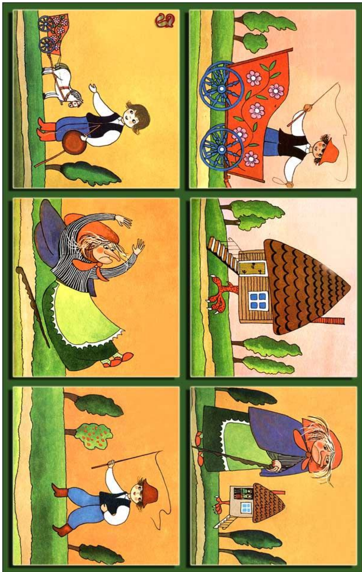
Źródło: „Malowany wózek” Hanna Ożogowska; wyd. Nasza Księgarnia 1985; Ilustracje: Z. Witwicki